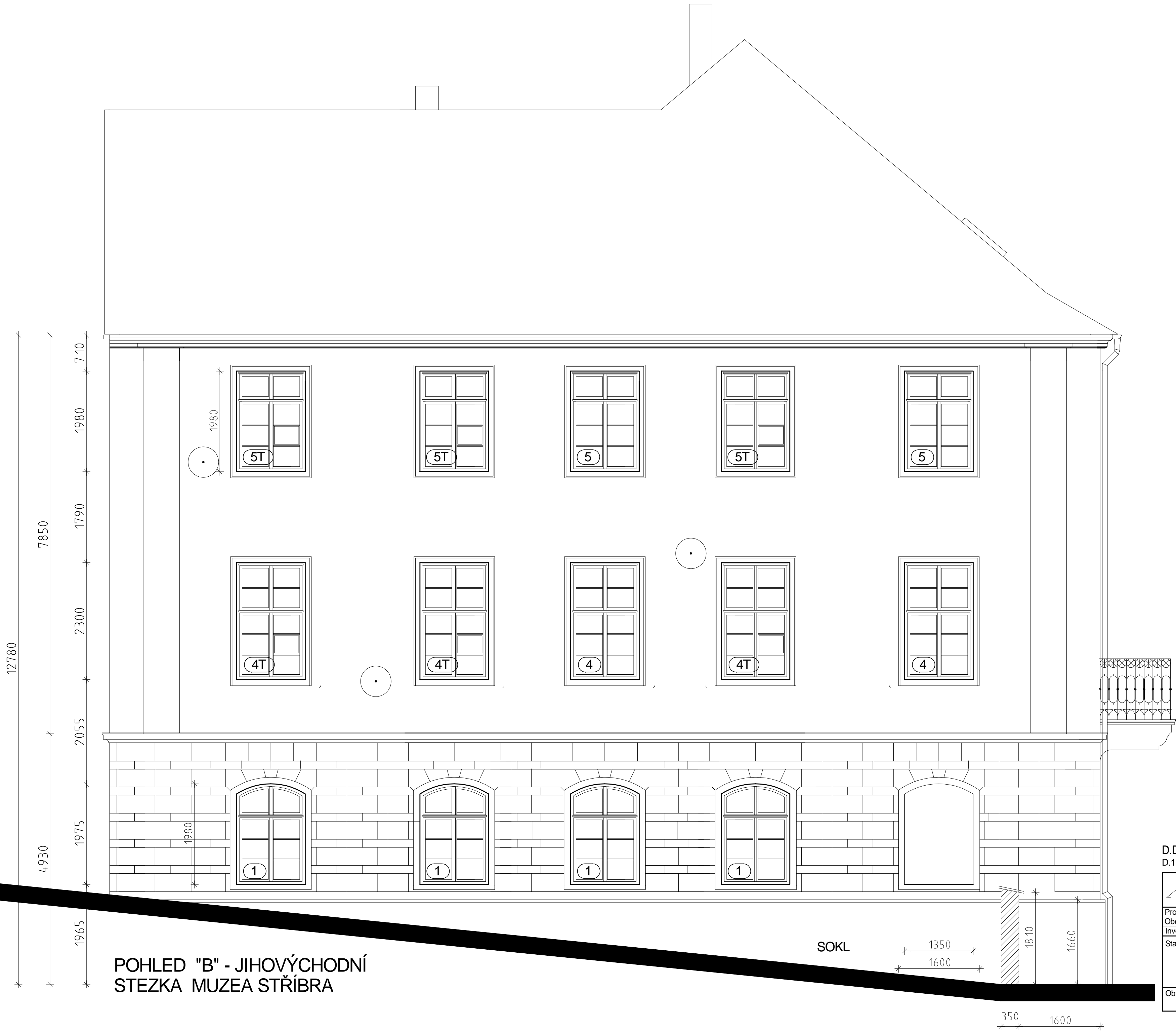
POHLED "B" - JIHOVÝCHODNÍ STEZKA MUZEA STŘÍBRA